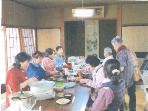
1月 作業の合間語らいも楽しい一時