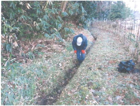
4 月 向こう井手水路草刈り泥上げ 可成り傷んで課題抱えた水路です。

令和 2 年度は新型コロナウイルスに戦々恐々とした、異常な年で、話し合いも十分持てず総会は書面議決により実施し、監査会は持ち回り監査と言う意気の上がない 1 年の、活動記録写真の一部分ですご覧下さい。