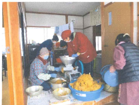
2月 今年の味噌の仕込み中 手前味噌のたとえに成った昔家での味噌作り知っている人は何人ですか？