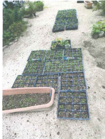
7月 マリーゴールド苗作り 安く良い苗がと努力しました