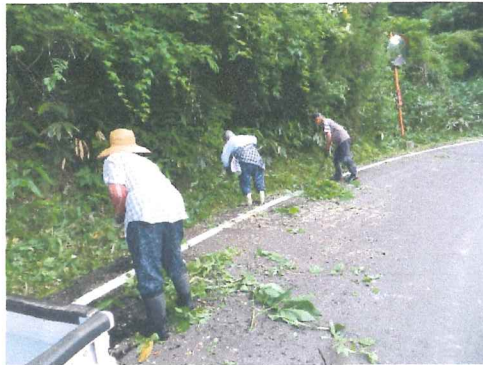
6 月 農道の草刈り 6 時は早いですが涼しい 内にと頑張りました