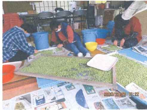
目が疲れて でも懸命に頑張りました