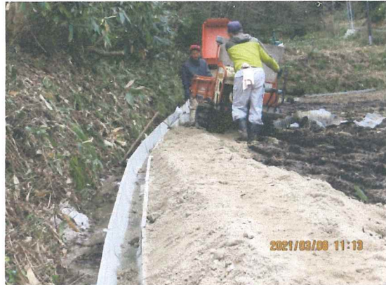
耕作に間に合うように懸命に頑張りました