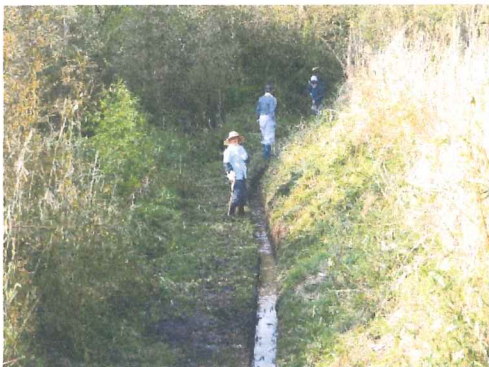
4 月 大原水路草刈り泥上げ 高齢化が進んで水路管理も大変です