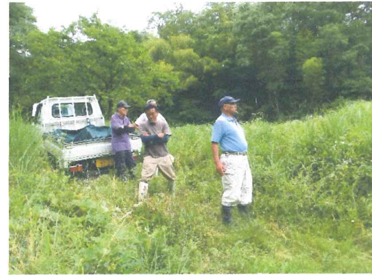
7月 機能診断問題点無くて