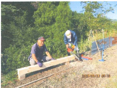
12 cm × 15 cmの角材にして 今岡製材所にお世話になる