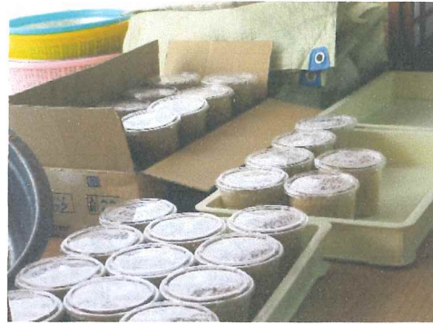
沢山作って要望に応える