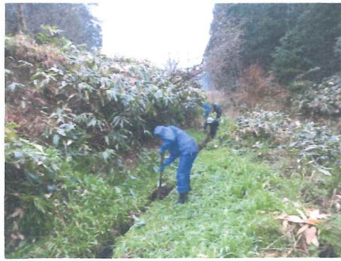
4 月 上井手水路草刈り泥上げ 延長 2 キロ余り頑張りました。