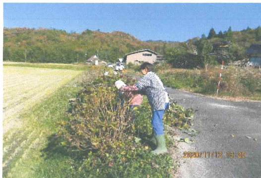
11月 中道沿いの紫陽花の剪定綺麗な花をつける事を楽しみに頑張りました