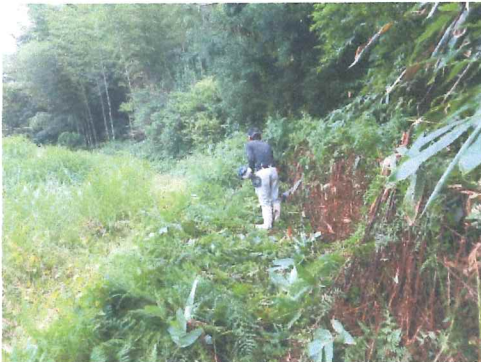
7月 猪防護柵管理道草刈り