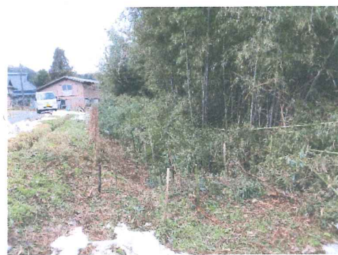
12月 竹藪整理の出来て 積る雪に道まで出る事もあり雪の備えも万端に