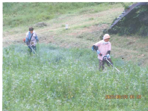
8月 休耕地荒廃防止草刈り 女性の皆さん頑張りました