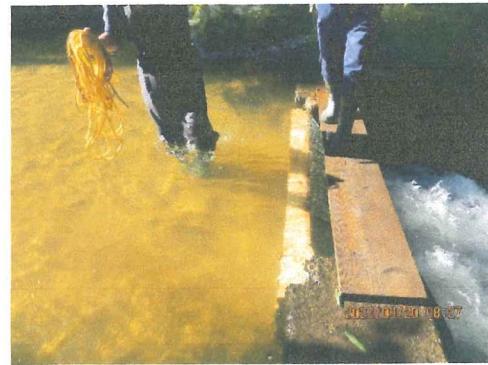
堰体の上に道板載せて作業する