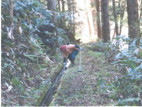
4 月 中井手草刈り泥上げ 林の中は落葉が大変