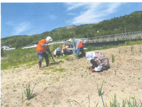
草に追われ花壇の管理も大変