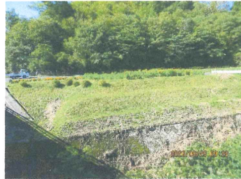
9月 花壇の川沿いもきれいに草刈りが出来て花壇が映えます