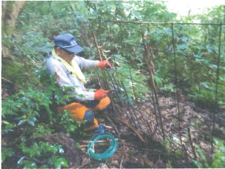
7月 ワイヤメッシュ補修 防護柵の隙間を狙う猪との知恵比べ