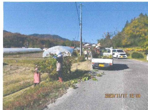
11月 上道沿いの紫陽花の剪定、木も大きくなって沢山の花が咲くでしょう