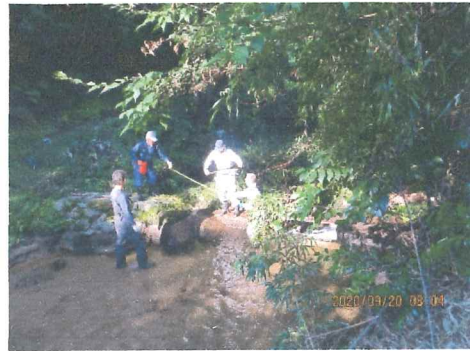
作業中事故が無いように