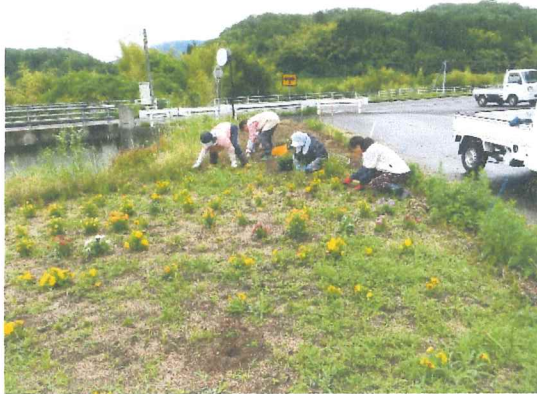
6月 直播のマリーゴールドの草取り 高齢化が進む度々の出役ご苦労さん