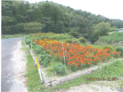
10月 8月に植えたマリーゴールド 綺麗に花壇を飾り喜ばれています