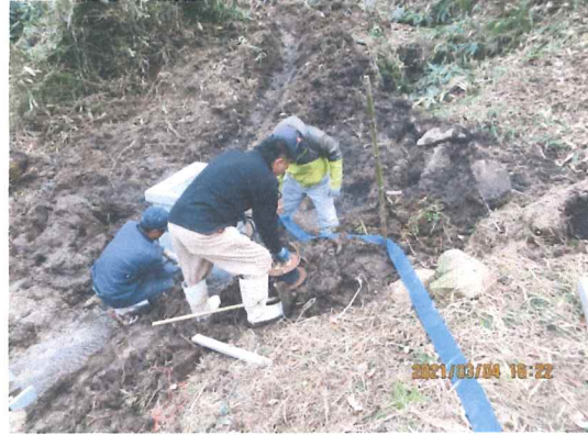
3月矢湊水路直営施工で始める