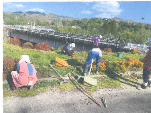
12月 もうすぐ雪が降りる和みや安らぎを与えて呉れた花壇も整理にはいる