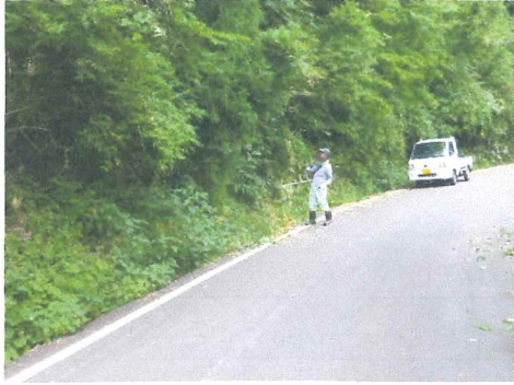
6月 水路農道を覆うように木が伸びて