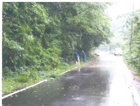
7月 矢淵宅上の草刈り