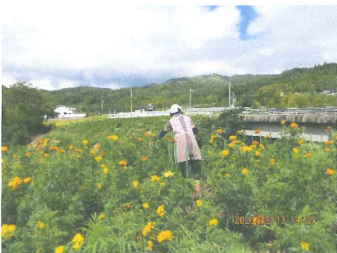
8月 観ては綺麗で和むが管理は大変 みんなの努力が有ってこそ美しい花が 見られます 有難いことです