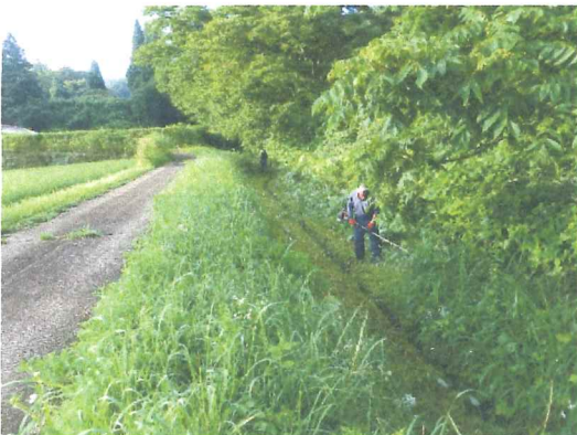
7月 中井手草刈り草に追われて 草は休みなくどんどん伸びて