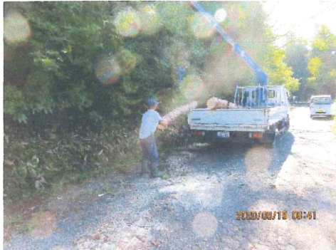
9月 生松は100年は寿命があるとの事 上井手の上に松の木が有り所望して

長寿命化の活動 300 年位前に猿隠山麓の桐木谷と上垣内奥を水源とする東川お墓山を水源とする梶川の水を川替えし約130アールの田圃を開くために落差10メートル滝淵が出来その滝の上に井堰が有り堰の埠が経年劣化して居り取り替える、益面積約400アール 滝壺の上でも有り傷害共済団体加入して工事にはいる