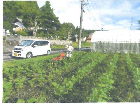
7月 大豆の土寄せ 今年も草との闘いが始まる