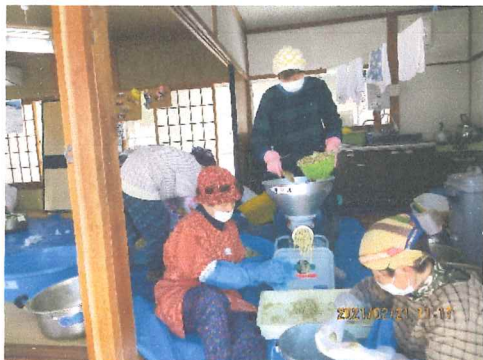
2月 大豆 麴 塩を混合し粉碎して味噌玉を作り 一年間味噌蔵で寝かせる 毎年味噌の味が 僅かに違い楽しみも増える