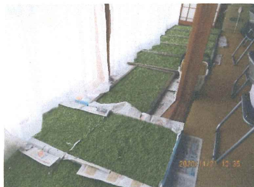
青大豆も沢山の収穫 集会所の縁側に並べて乾燥させて