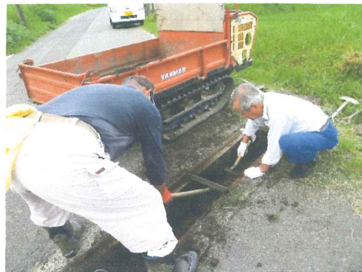
7月 暑い中ご苦労さん