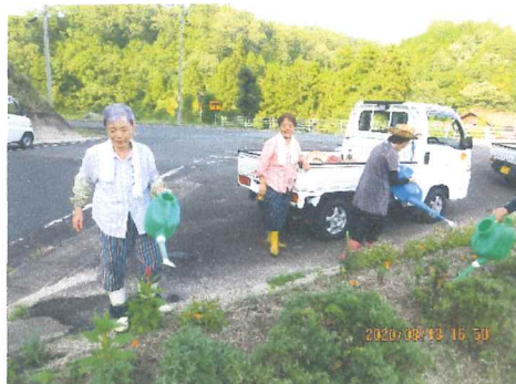
8月 晴天が続き花壇に水遣り 暑い中の作業大変です