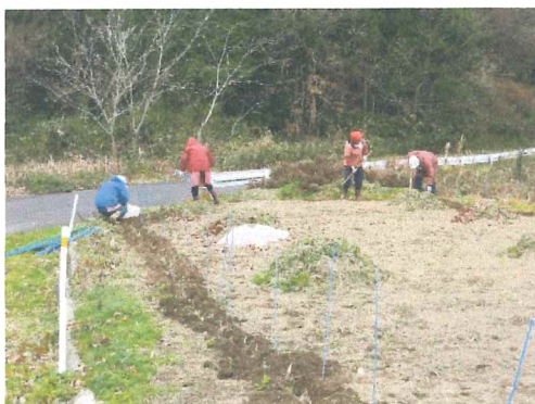
12月 花壇は来年の準備が始まる 周りに水仙を植えて