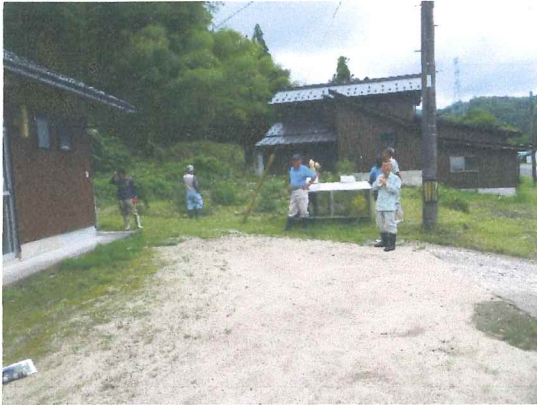
7月 機能点検機能診断を終えて