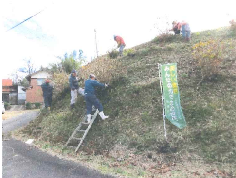
12月 紫陽花の剪定 遠くからの眺めは映えるが管理は大変 梯子を使って