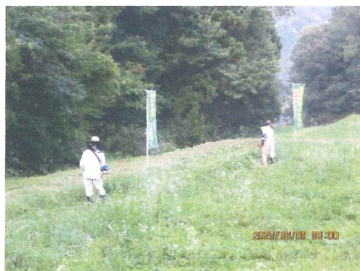
8月 休耕地荒廃防止草刈り 草の成長早い