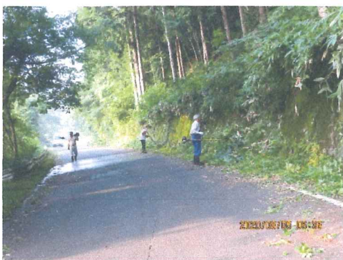
8月 農道の草刈り作業 事業を始めて9年目歳は休んで呉れない