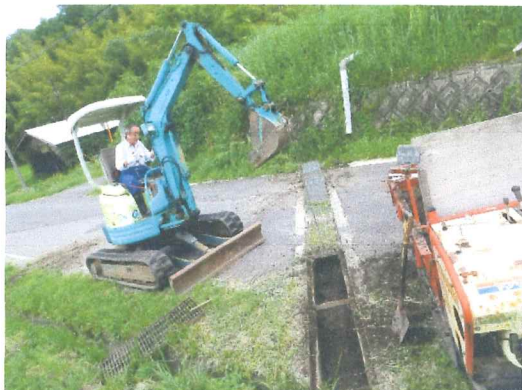
7月 グレーチング下の泥上げ