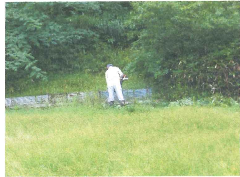
7月 猪防護柵管理道の草刈り