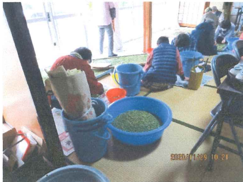
11月 青大豆の芥取 根気の要る仕事