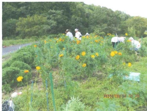
8月 支柱立てたり草を取ったり