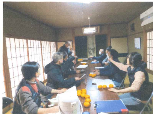
役員会の一コマ 女性の皆さんの活躍が 集落を元気付けている 頑張ろう集落