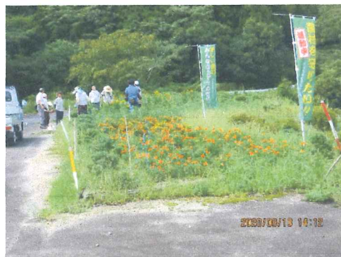
8月 草取り作業始める前の打ち合わせ