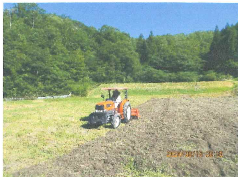
8月 休耕地荒廃防止耕して 蕎麦を蒔く準備