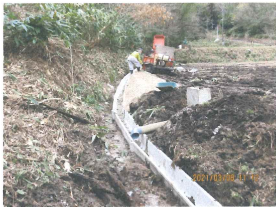
ぬかるんだ田圃を通過して作業難渋しました