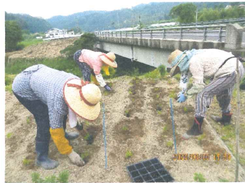
6月 花壇にマリーゴールド苗植え