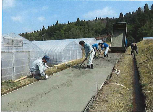
未舗装農道を舗装（コンクリート）

【農道本体】未舗装農道を舗装（砂利、コンクリート、アスファルト）、橋梁の更新 【附帯施設】側溝蓋の設置、土側溝をコンクリート側溝に更新