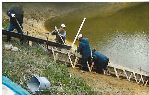
取水施設の補修（斜樋）