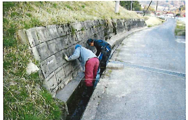
農道側溝の補修（空洞部にセメントを充填）