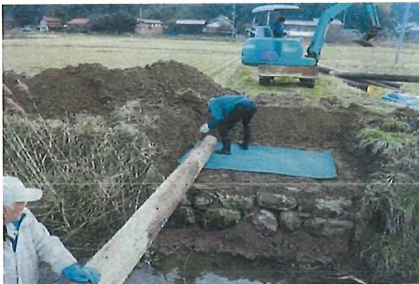
橋梁の補修（老朽化した橋を中古電柱を利用して補修）