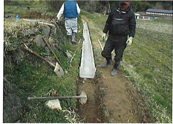
水路の更新（一路線全体）