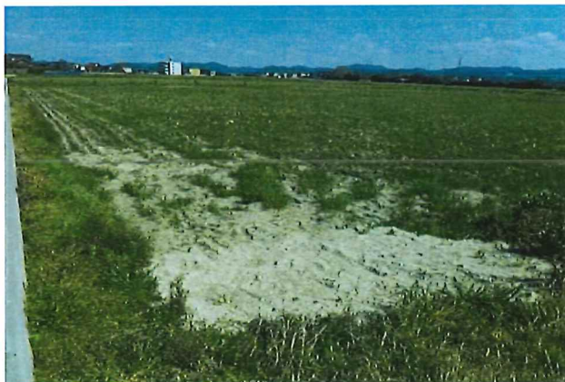
客土（沈下により支障が生じている 農地に客土）

給水施設（栓）の設置、客土、進入路等の更新、草刈り用小段の設置、 スプリンクラーの更新