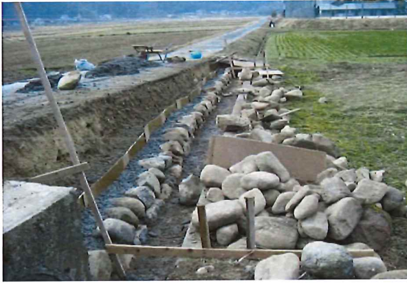
農道路肩・農道法面等の補修

【農道本体】 農道路肩・農道法面等の補修、舗装の打替え（一部）、橋梁の補修 【附帯施設】 農道側溝の補修