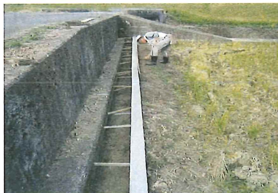
老朽化部分の補修