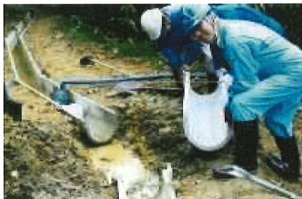
水路の破損部分の補修

【水路本体】 破損部分及び老朽化部分の補修、水路側壁の嵩上げ、既設水路の再布設 【附帯施設】 集水桝・分水桝、ゲート・ポンプ等、安全施設、取水施設、 制水弁・空気弁等及び水路法面の補修