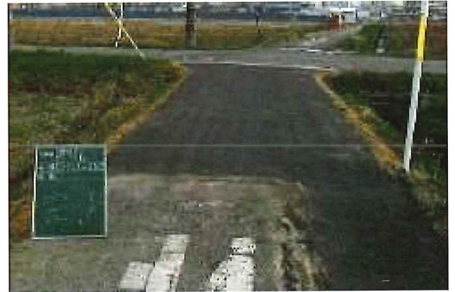
舗装の打替え（一部）