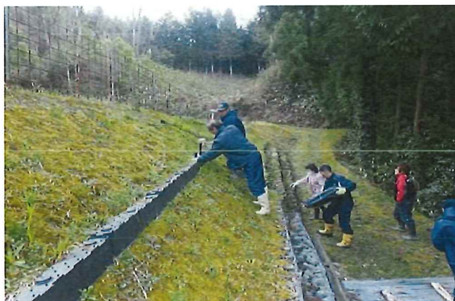
草刈り用小段の設置