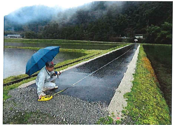
未舗装農道を舗装（アスファルト）