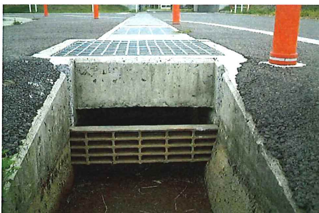
安全施設の設置（転落時の事故防止のための柵を設置）