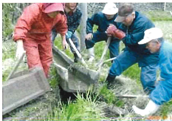
U字フリーム等既設水路の再布設