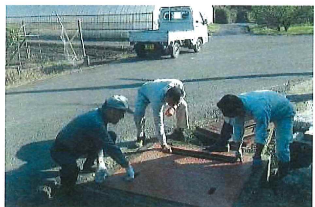
安全施設の設置（転落防止のため蓋を設置）