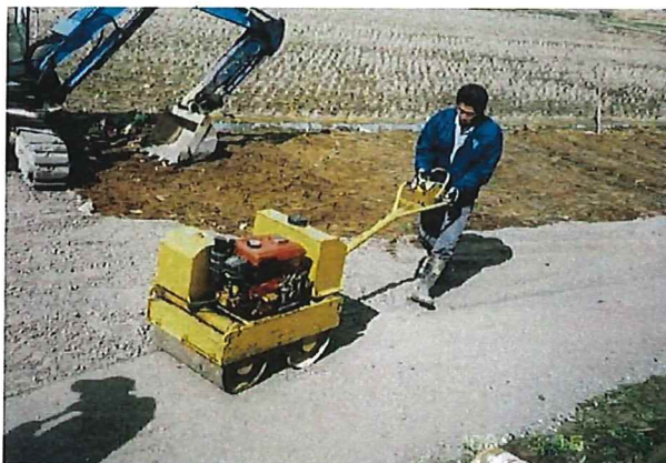
未舗装農道を舗装（砂利）