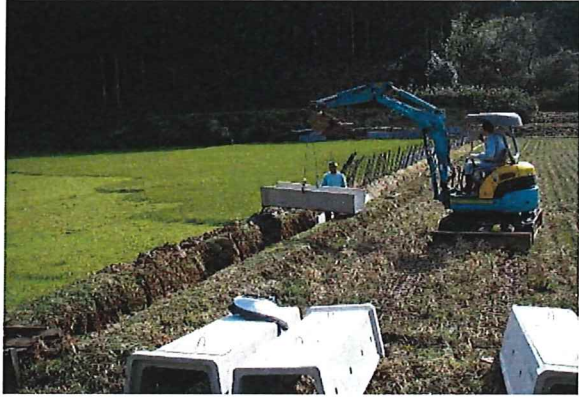
素掘り水路からコンクリート水路への更新

【付帯施設】ゲート・ポンプの更新、安全施設の設置、制水弁・空気弁等の更新、水路蓋設置