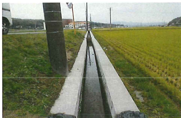
水路側壁の嵩上げ