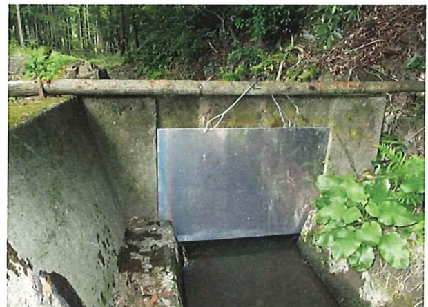
ゲート（水門板）の更新