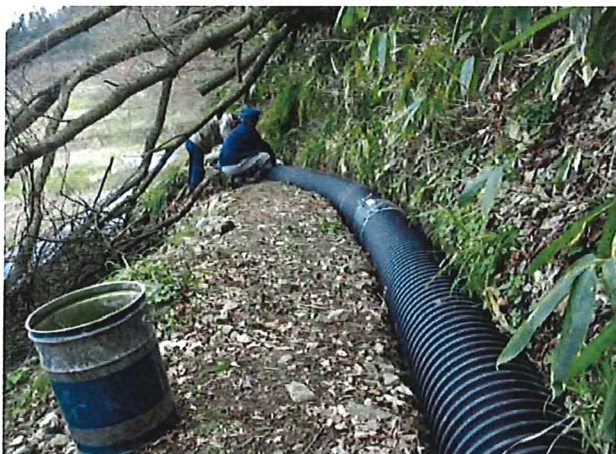
開水路からパイプラインへの更新