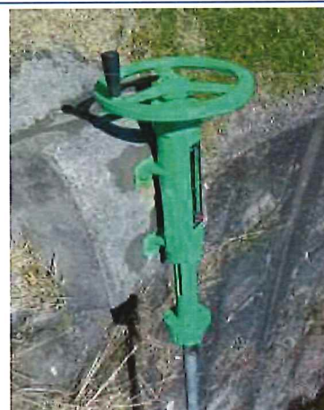
ゲート・バルブの更新