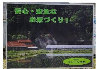
クリーン堆敷(吉賀町)