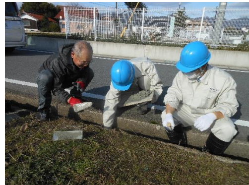
地域の方から指導を受けている様子

約3時間の作業を終え、老朽化が目立っていた水路は、生徒たちの手で無事、元の機能を取り戻すことができました。