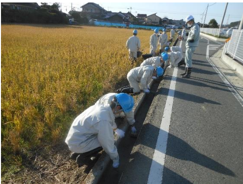
水路のコーティング作業