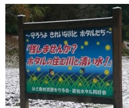
はざ農村資源を守る会 (浜田市)