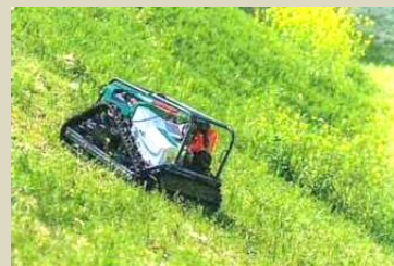
ラジコン草刈機 スパイダーモア