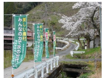
地頭所環境保全活動組織 (美郷町)