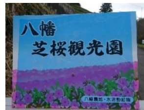
八幡農地・水活動組織 (出雲市)