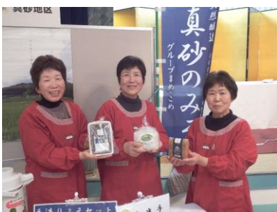
(農)グループまめ・こめ