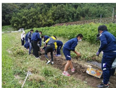
サツマイモの収穫