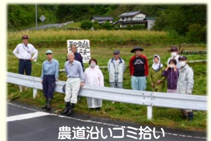
農道沿いゴミ拾い

活動は、不在地主の農地の草刈り、猪防護柵の補修、設置、農道等の補修、ヒマワリ、菜の花の植栽、農道沿いのゴミ拾い等、集落の皆さんと力を合わせて行っています。