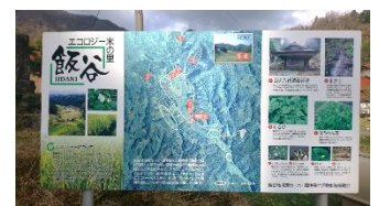
飯谷地域農地・水・環境保全 活動推進協議会（大田市）