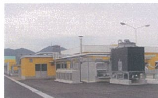
○青汁工場((株)キューサイ)