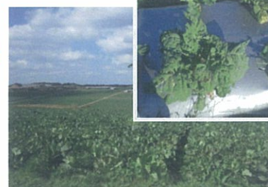
○キューサイファームほ場