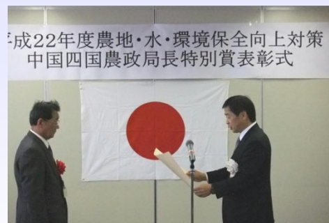
3月11日表彰式（於：中国四国農政局）