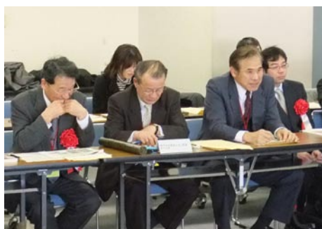
表彰式後の意見交換会での岩瀬会長・藤原副会長・竹下常任理事（左から）

神門地区では、新興住宅地内の一部で自治会が設立される見通しとなるなど、新しい地域コミュニティが広がりつつあります。